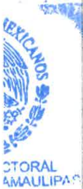
Firma de entrega del Aspirante